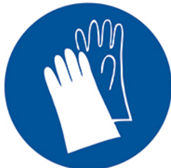
РАБОТАТЬ В ЗАЩИТНЫХ ПЕРЧАТКАХ (РУКАВИЦАХ)