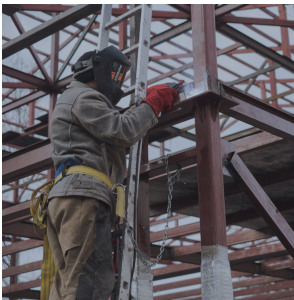
Строительство, монтаж металлоконструкции