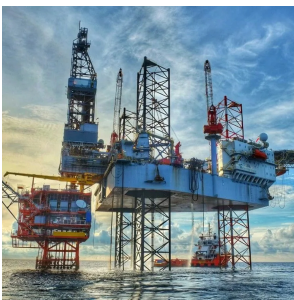
Нефтегазодобываю щая промышленность