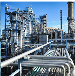
Нефтеперерабаты вая промышленность