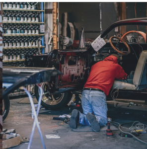
Гаражные, дачные, мастерские работы