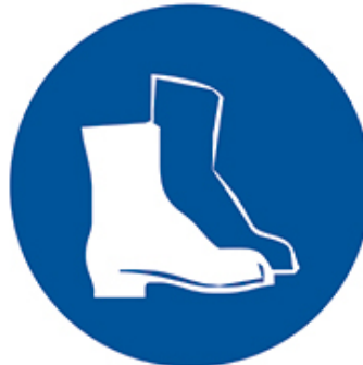
РАБОТАТЬ В ЗАЩИТНОЙ ОБУВИ

Аппарат воздушно-плазменной резки HUGONG INVERCUT 100 III разработан и изготовлен по инверторной технологии на базе новейших IGBT транзисторов, благодаря чему имеет высокие показатели по КПД преобразования электрической энергии, малый вес и высокую надежность.