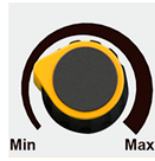
РЕГУЛЯТОР СВАРОЧНОГО ТОКА