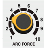
РЕГУЛЯТОР ФОРСАЖА ДУГИ