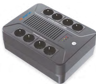
ИСТОЧНИК БЕСПЕРЕБОЙНОГО ПИТАНИЯ