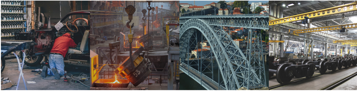
Гаражные, дачные, мастерские работы